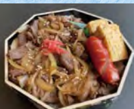
ジャムジャムツアーオリジナル「飛騨牛八角弁当」