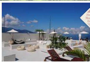
7 HAKUBA MOUNTAIN BEACH