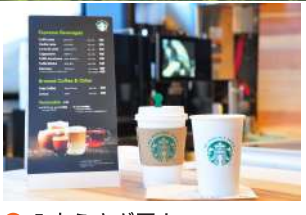
5 八方うさぎ平カフェ