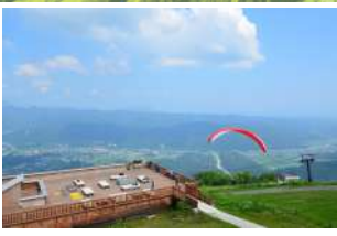
4 Corona Escape Terrace