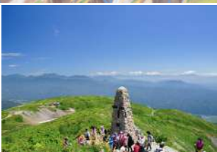
2 八方ケルンから見渡す360°の山並み