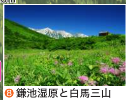
8 鎌池湿原と白馬三山