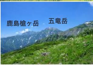
3 迫力の北アルプスの稜線