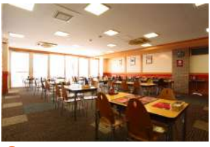
6 イタリアンレストラン「軽井沢プリモ」