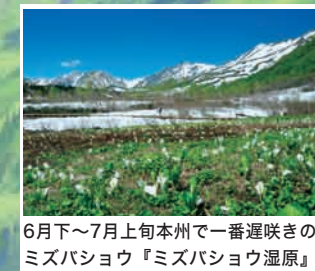
6月下旬～7月上旬本州で一番遅咲きの ミズバショウ『ミズバショウ湿原』