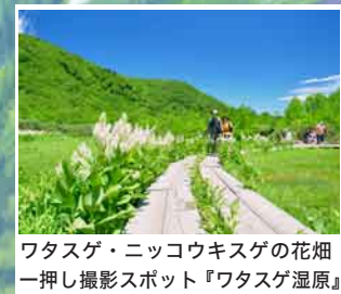
ワタスゲ・ニッコウキスゲの花畑 一押し撮影スポット『ワタスゲ湿原』