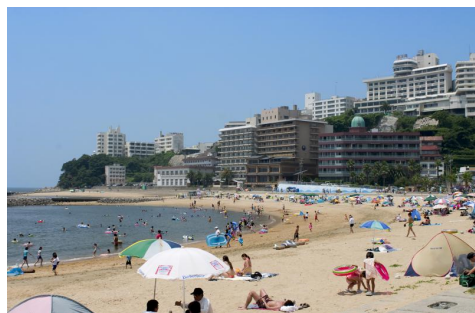
西浦温泉バームビーチ