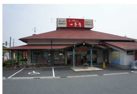
えびせん工房(一色屋)