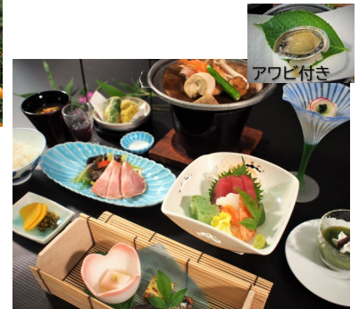
ジャムジャムツアーオリジナル「末広膳」