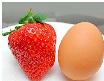
大きいもので卵サイズ50g前後となります!