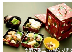
季節で献立・器異なります