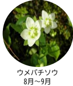
ウメバチソウ 8月~9月