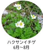
ハクサンイチゲ 6月~8月