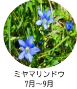
ミヤマリンドウ 7月~9月