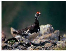
出会えたら幸運！ライチヨウ