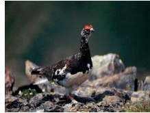
出会えたら幸運！ライチヨウ