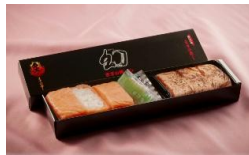
ます寿司食バビ弁当