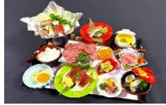
A5近江牛すき焼き御膳 +1,500円