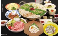
近江牛もつ鍋御膳